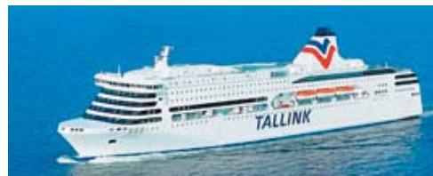
För garvade motormän: M/S Romantika

Tro det eller ej, men vår stenhårda tropp av garvade motormän i sina bästa år kommer att åka med M/S Romantika! Nu tror jag att vi kan få en gentleman-gin/tonic trots namnet på båten!